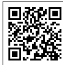
コンクール 特設ホームページ

【個人情報の取り扱いについて】応募の際に収集した個人情報については応募内容の確認や受賞のご連絡、賞品の配送等、本コンクールの運営に関する目的でのみ使用いたします。